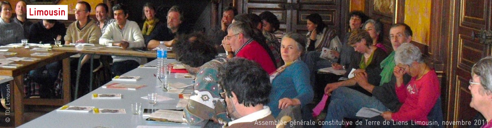
Assemblée générale constitutive de Terre de Liens Limousin, novembre 2011