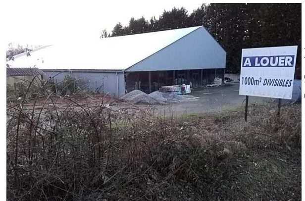
Légende · route de Poitiers à Couzeix : entrepôt terminé depuis plusieurs années et jamais utilisé (proposé à la location) ; il est couvert avec des panneaux PV depuis sa construction