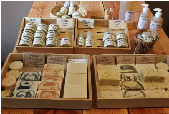
Légende · Les savons, baumes et pommades de Luz

// Pierre Rigondaud, référent de la ferme des Nègres