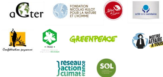
Légende · Les 10 organisations qui demandent une loi foncière en 2021

Pour mieux partager et protéger la terre, 10 organisations dont Terre de Liens demandent ensemble une loi foncière en 2021 .