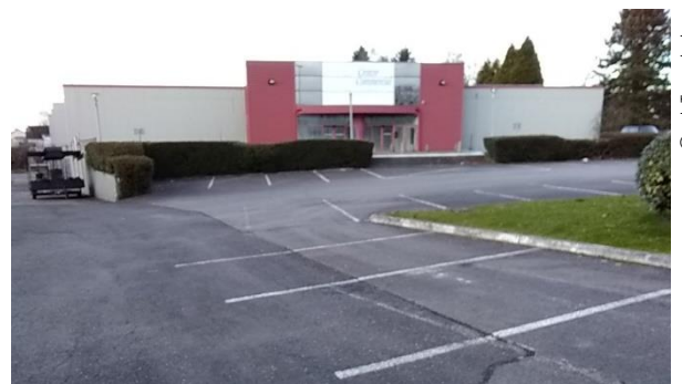
Légende · ancien magasin de mobilier (BUT) à Couzeix transféré sur une autre zone, et fermé depuis plus de 5 ans