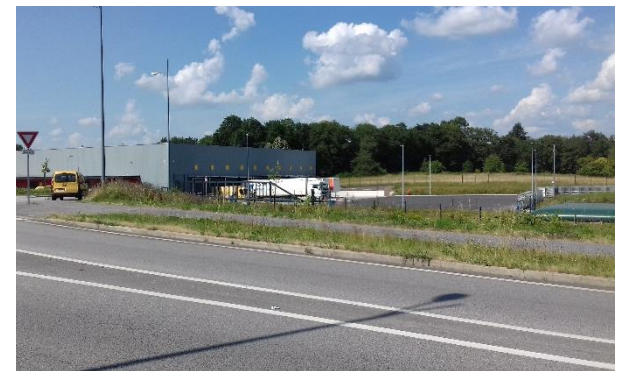
Légende · La Grande Pièce à Limoges n°2, le 25 juin 2020