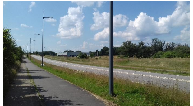
Légende · La Grande Pièce à Limoges n°1, le 25 juin 2020

> Plus d'infos auprès de Pierre Texier (06 44 89 60 49) ou de Vincent Laroche (06 26 46 32 62).