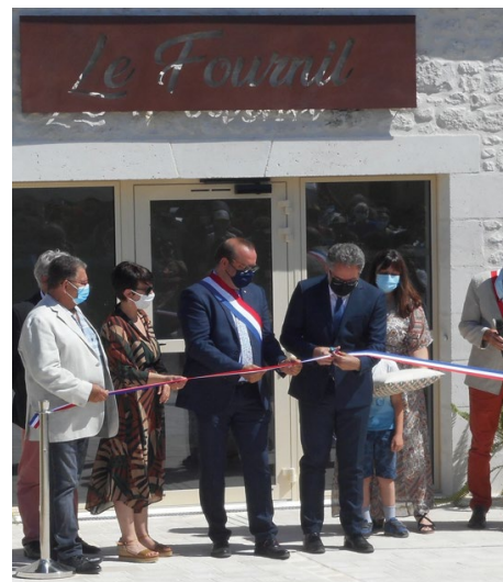
↑ Inauguration du fournil à Thézac

En 2021, nous avons continué les échanges avec les acteurs régionaux et en particulier avec la région Nouvelle-Aquitaine (contributions au plan stratégique nationale de la politique agricole commune, participation à la définition du schéma régional de biodiversité). Terre de Liens Nouvelle-Aquitaine a également apporté son expertise en participant au Comité Régional d'Installation et Transmission (CRIT).