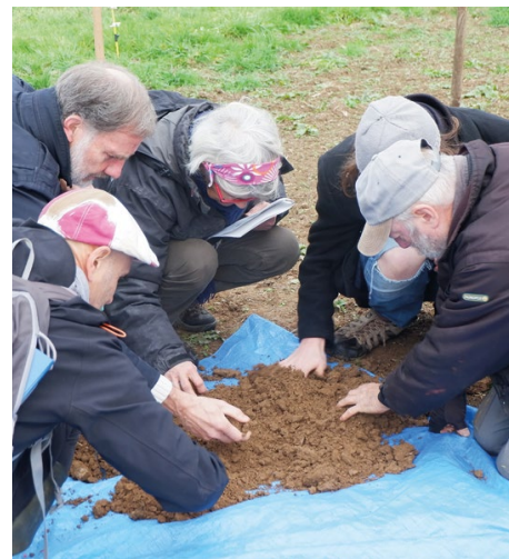
↑ Etat des lieux des terres de la Ferme des Sailles - TDL Limousin ↙ Les fermiers de Jean-de-Vezin - TDL Aquitaine

fermier, un appel à candidatures a eu lieu et le candidat sélectionné devrait s'installer en 2022. Un travail de réflexion avec le fermier sur la construction d'un nouvel habitat est mené sur la ferme de Châtres (87) tandis que l'acquisition de terres supplémentaires et d'un bâtiment a été validée sur la ferme de la Solive (79). La commission régionale « Suivi des fermes » permet la capitalisation et l'échange autour du suivi des fermes : suivi des besoins des fermiers, questionnement autour de l'état du bâti, de la pérennisation de l'activité, de la transmission, etc.