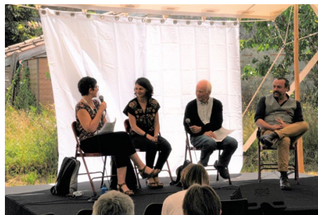
↑ Festival International du Journalisme « la terre, marchandise ou bien commun ? » juillet 2021

A travers ces démarches Terre de Liens souhaite permettre au plus grand nombre de mieux appréhender les enjeux de préservation du foncier agricole pour faciliter leur engagement sur ce sujet. Nous soutenons ainsi que l'avenir de nos terres agricoles est bien l'affaire de tous et que leur sauvegarde repose sur l'implication du plus grand nombre.