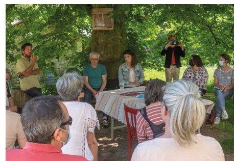
↑ Ferme ouverte organisée par le réseau InPACT Nouvelle-Aquitaine en Haute-Vienne.

Enfin en fin d'année nous avons lancé une commission régionale Collectivités, composée de salariées et bénévoles qui travailleront en 2022 à la construction d'une offre d'accompagnement à destination des collectivités locales. Elle s'appuiera notamment sur l'initiative de CAAP 24 en Dordogne.