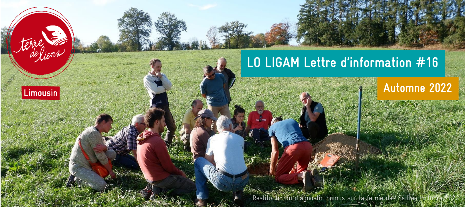
Restitution du diagnostic humus sur la ferme des Sailles, octobre 2022