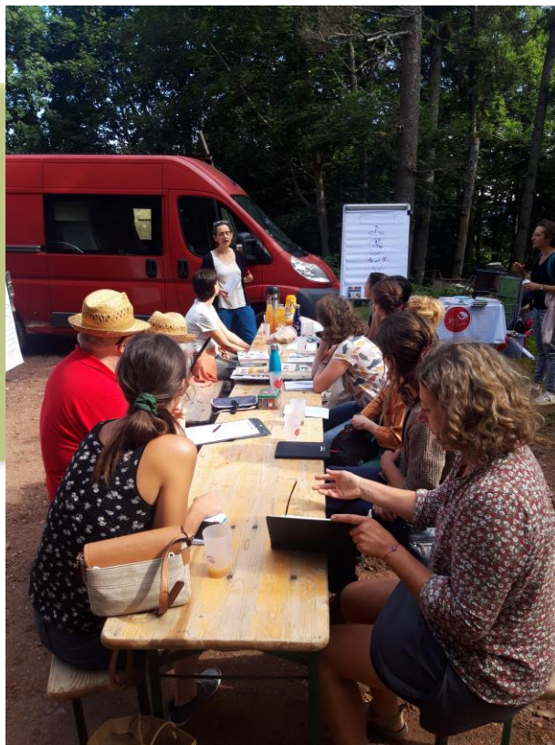
Visite apprenante « laine » à la ferme à la Bassette.

« Convaincu que la préservation de notre santé, de notre environnement et de nos liens sociaux passe par une (r)évolution des pratiques agricoles, je suis récemment devenu membre de Terre de Liens. Un des éléments qui m'a particulièrement attiré, c'est la palette d'ateliers proposée par l'association. Que ce soit sur le terrain, lors de visites apprenantes ou de chantiers à la ferme, de journées de rencontre et d'échanges à propos du foncier, de l'agriculture bio, de l'accompagnement des porteurs de projets et autres sujets variés, les ateliers sont pour moi une motivante occasion d'apprendre à devenir acteur et de faire de belles rencontres. Le 30 juin dernier, je participais à l'atelier sur l'accompagnement des porteurs de projet en compagnie d'une dizaine d'autres membres de Terre de Liens, amapien.nes, apiculteur, woofers, associatifs ou simplement bénévoles. Nous avons découvert les spécificités foncières et agricoles de la vallée d'Orbey et les défis de