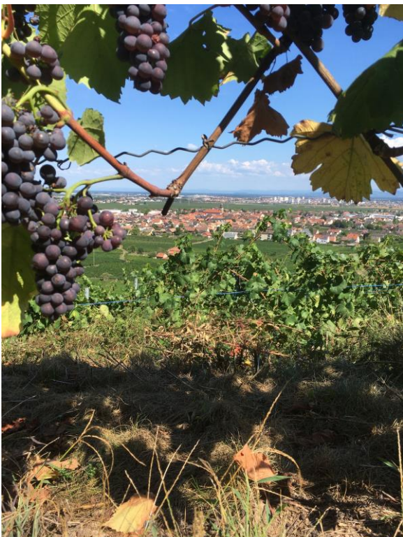
Warstein, vue de la dernière terrasse.

Pour chaque bail signé, la Foncière Terre de Liens demande un état des lieux d'entrée qui fait état de la situation des terrains au moment de l'achat. C'est donc entourée d'une équipe de bénévoles, équipés de pelles, tarières et seaux, que nous avons organisé notre tour de plaine à Boofzheim par une belle journée printanière. En présence d'Étienne, le fermier, nous sommes allés à la découverte de trois parcelles typiques de la ferme : le pâturage des vaches, une prairie temporaire et une parcelle en culture de céréales. Comptage de vers de terres, carottages et lecture du sol étaient au programme, avec l'aide de nos experts du jour Ludovic Boise et Hélène Clerc. Tous ont écouté attentivement Étienne parler de son activité et de ses projets. Un sympathique pique-nique partagé avec les bénévoles d'Eco Bio Alsace a également permis de mieux faire connaissance avec « nos voisins » ! ♦